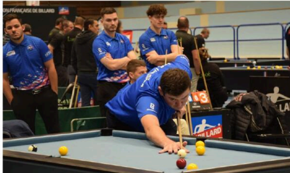
L'équipe des Herbiers en action.

Et côté sportif, il y avait du très haut niveau, avec les membres des équipes de France hommes et femmes. D'ailleurs, la finale a opposé le champion du monde Yannick Beaufile à